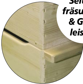
Seitenfräsungen & Griffleisten