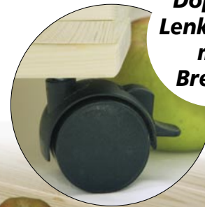
Doppel-Lenkrollen mit Bremse